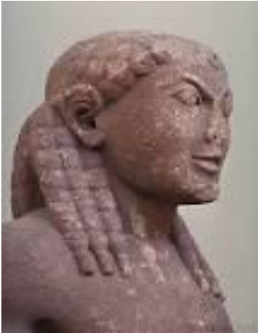
Корэб Элидский Победитель первых Олимпийских игр