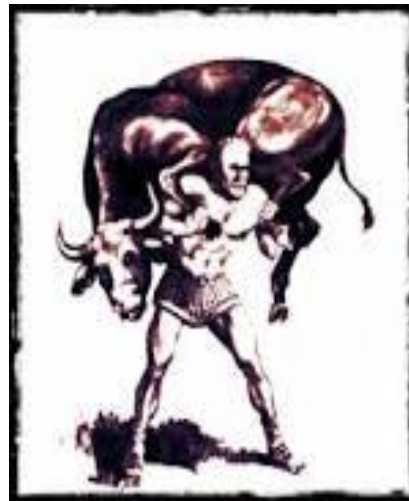
Милон Кротонский Борец, сильнейший среди сильных, Ученик Пифагора