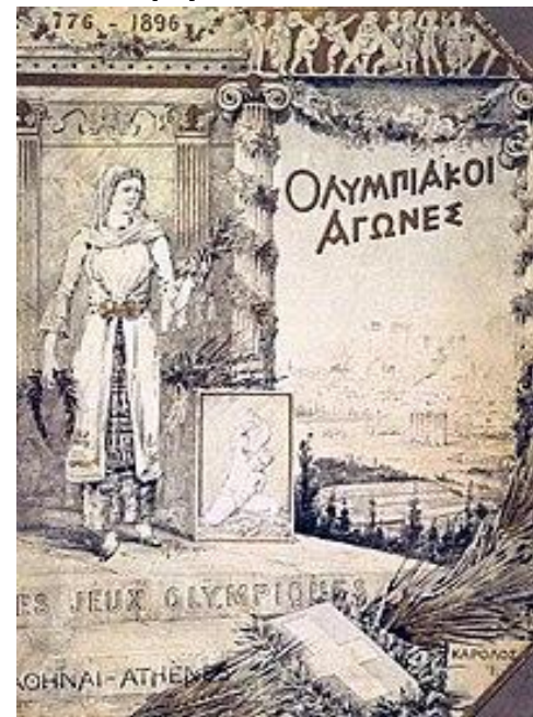
Плакат первых игр